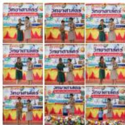
โรงเรียนบ้านตำแยหนองเม็ก - ภูเก็ต 81100